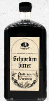
Wurzelsepp Schwedenbitter Für die Verdauung